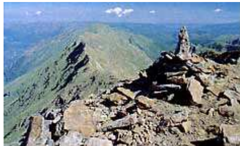
Cim nord del pic de l'Aspre amb la pica d'Endron al fons a l'esquerra.

El pic de l'Aspre, dins de terreny occità, sorprèn per la seva forma piramidal, encaçalant la llarga serra que l'uneix a la pica d'Endron. Una de les maneres més pràctiques d'assolir-ne el cim és des dels estanys de Tristaina, a Andorra.